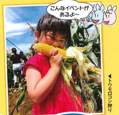
▲トウモロコシ狩り