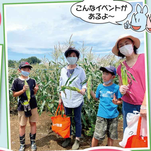
▲トウモロコシ狩り