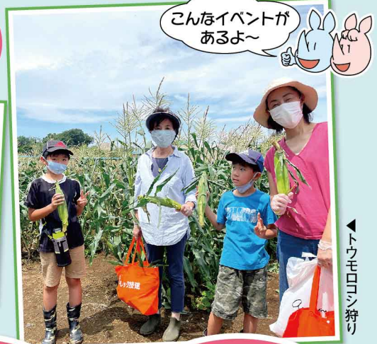
▲トウモロコシ狩り