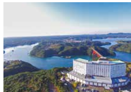
ホテル&リゾート伊勢志摩