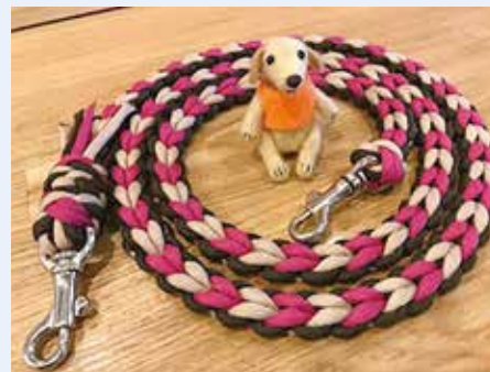
今回作成する「リード」