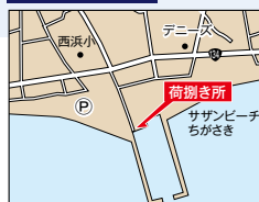
茅ヶ崎漁港案内図