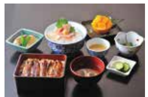
昼食 川魚御膳 (川豊別館提供) ※うなぎが苦手な方は天丼となります。