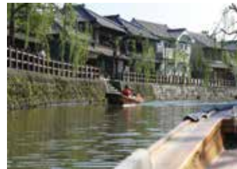
川面からの佐原町並み