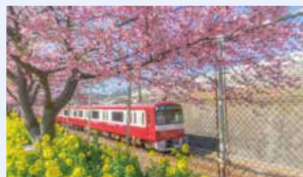
※画像はすべてイメージです