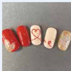
※画像はすべてイメージです