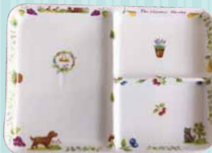
▲ランチプレート見本 25×18cm 厚さ2.5cm