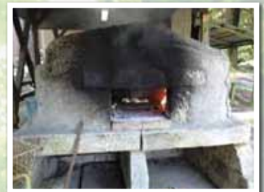
▲ピザ焼き(イメージ)