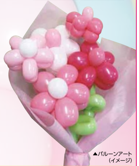
▲バルーンアート (イメージ)