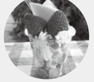
▲イチゴパフェ(イメージ)