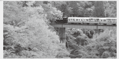
▲トロッコ列車(イメージ)