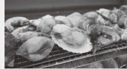
▲昼食浜焼き(イメージ)