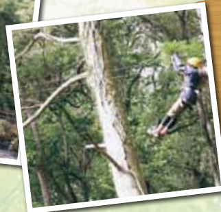
▲ジップライン(イメージ)▼