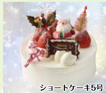
ショートケーキ5号