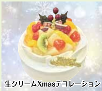
生クリームXmasデコレーション