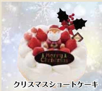
クリスマスショートケーキ