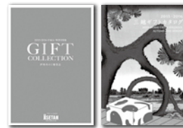
伊勢丹カタログ 三越カタログ

※お問い合わせの際には、必ず湘南勤労者福祉サービスセンターの会員である旨をお伝えください。