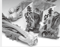
▲ザーサイ(イメージ)