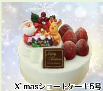
X'masショートケーキ5号

テラスモール湘南店 藤沢市辻堂神台1-3-1 テラスモール湘南1F TEL 0466-86-7222