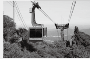
◀筑波ロープウェイ