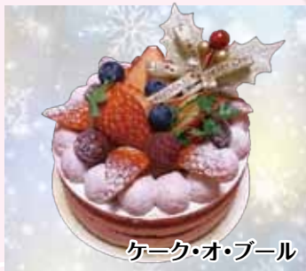
ケーキ・オ・ブール