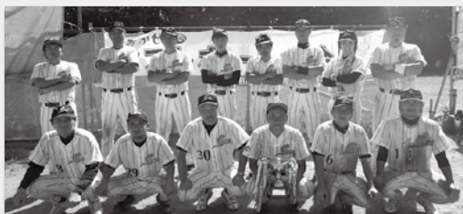
昨年度 優勝チーム S.B.C