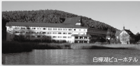
白樺湖ビューホテル