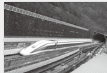
▲トレジャーハンティング(イメージ) ▲リニア見学センター(イメージ)