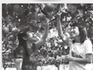
まつもと果樹園▶ 梨狩り(イメージ)