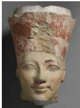
《ハトシェプスト女王像の頭部》 Rogers Fund, 1931 (31.3.153)