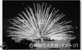
白樺湖花火大会(イメージ)

集合場所及び出発時間 ①鎌倉郵便局前 7:00 ②藤沢NDビル前 7:30 ③茅ヶ崎中央公園横 8:00